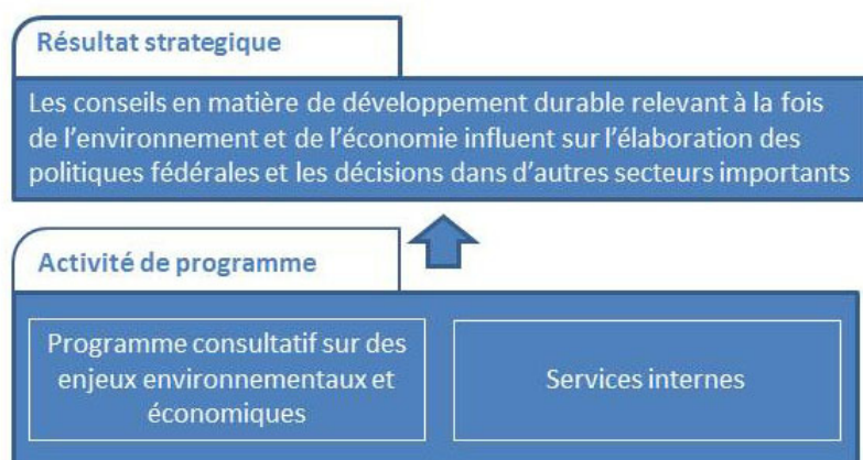
Figure 2 : Architecture de l'activité de programme (AAP)